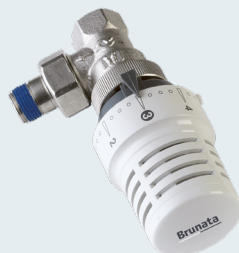
Termostatski ventil Prihranek do 20%

Ventil je primeren za klasični dvocevni sistem ogrevanja.