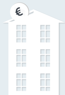
Skupaj 20 do 30%